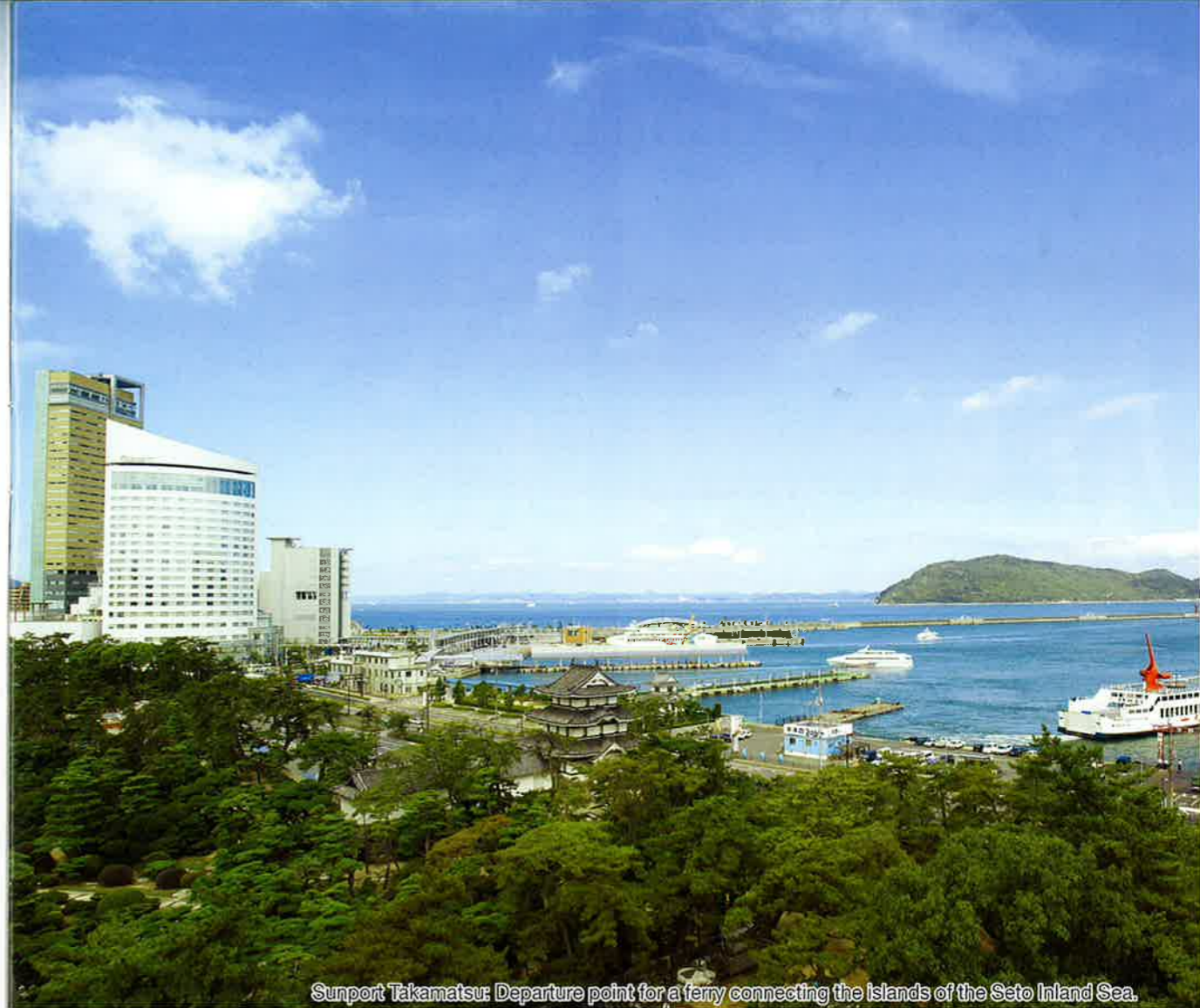
Sunport Takamatsu: Departure point for a ferry connecting the islands of the Seto Inland Sea.

Note: ( ) of each temple shows the temple number of the 88 sacred temples of shikoku. 每个寺院的 ( ) 是四国八十八个灵场的编号。각 절의 ( ) 는 시코쿠 88개소 영지의 표시 번호입니다.